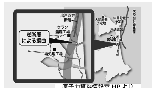
原子力資料情報室 HP より